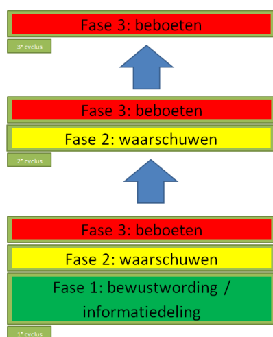
Figuur 1. Cyclus projectgerichte benadering

In de derde fase kan het beboeten ook gelezen worden als handhavend optreden, omdat in sommige gevallen een last onder bestuursdwang wordt toegepast in plaats van beboeten. Denk hierbij aan het handhaven van wrakken in de openbare ruimte.