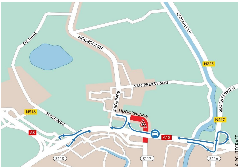
Fase 1 – omleidingen

Tijdens Fase 1 kunnen de bewoners via het Zuideinde gebruik maken van de IJdoornlaan en zo de ring op. De mensen die naar Utrecht moeten, kunnen via de Coentunnel via de A10-west gaan of zij kunnen via de volgende afslag S118 onderlangs en terug via de binnenring.